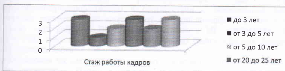
Диаграмма с характеристиками кадрового состава МБДОУ. Стаж педагогических работников

В 2023 году педагоги МБДОУ приняли участие: