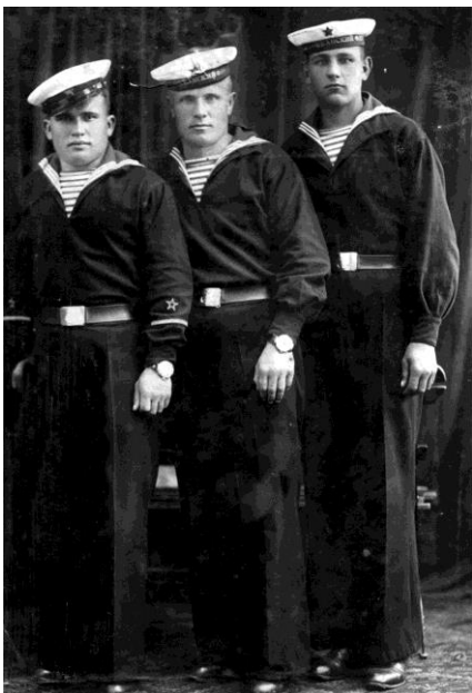
На дальнем Востоке, береговая артиллерия ТОФ 1940г. (1)