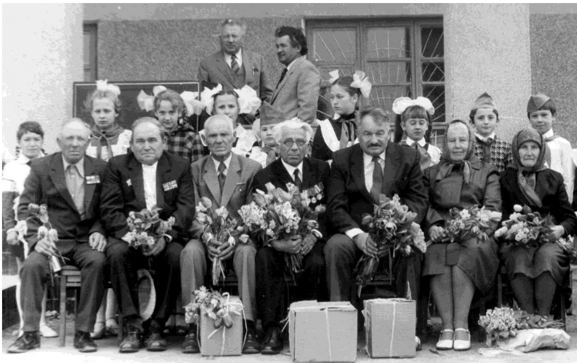
Встреча ветеранов ВОВ на День Победы 1988г.