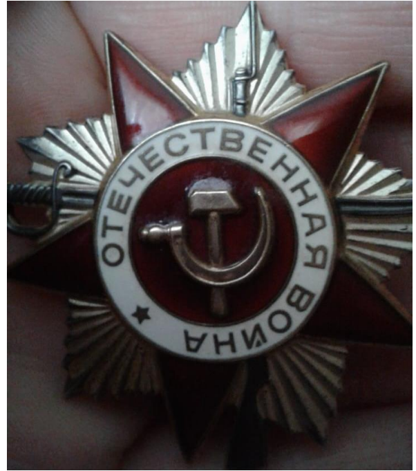
Орден Отечественной войны II степени. 1985г.